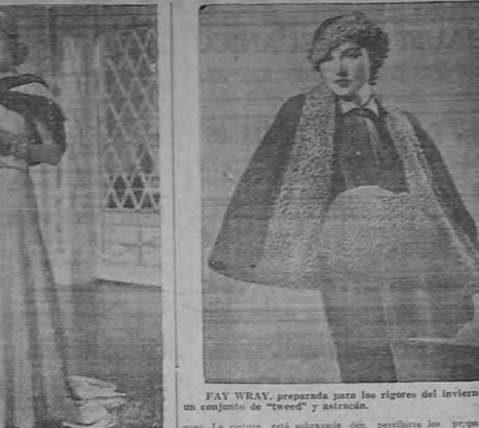
FAY WRAY, preparada para los rigores del invierno, con un conjunto de "tweed" y astracán.

HOLLYWOOD, enero 1935. — Adrián, el "couturier" más popular de la capital del cine, acaba de confeccionar un modelo para Constance Bennett, que la artista usará en su nueva película "Charlas de la Ciudad".