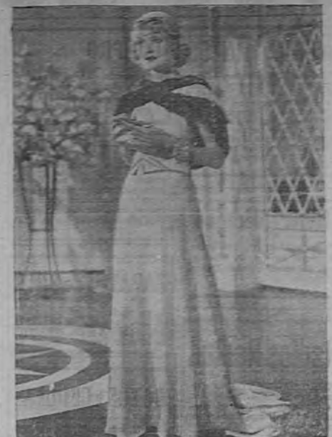
CONSTANCE BENNETT luce un modelo para la noche, confeccionado especialmente por Adrián.

Un modelo de Adrián, de Hollywood. — Otro de Fay Wray, de confección inglesa