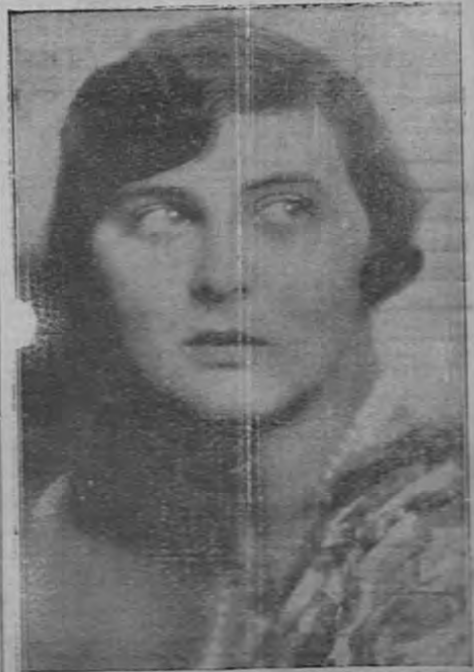
Una de las últimas y más bellas fotos de la Duquesa de Kent.