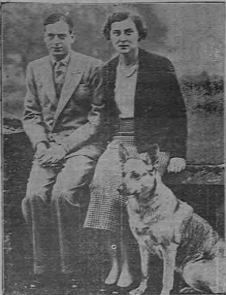
El duque de Kent y su esposa. Foto tomada en Himley Hall, Staffordshire, en donde estuvieron después del enlace.

Por las espaciosas naves de la suntuosa catedral, repleta de representantes de las familias de más alta alcurnia de Europa, con den los armoniosos acordes de la marcha nupcial. Las campanas de la Abadía de Westminster lanzan al vuelo sus más armoniosos sonidos. La multitud, congregada en la calle y en las puertas, ventanas y azoteas de las casas vecinas prorrumpen en jubilosos gritos de aclamación. La ceremonia ha terminado, dando fin a la boda más suntuosa que se haya celebrado en estos últimos años, la del príncipe Jorge de Inglaterra con la Princesa Marina de Grecia.