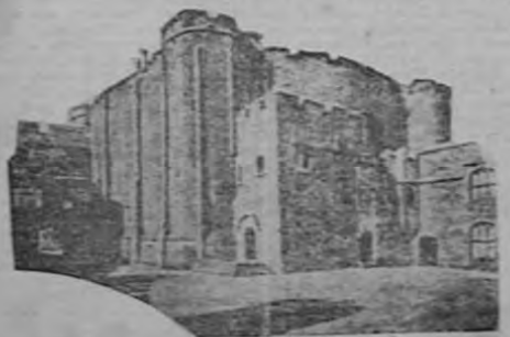
Entrada del castillo de Berkeley. Por las noches, se oyen en los pasillos los gritos tenebrosos que lanzara el rey Eduardo, cuando sus asesinos le hundieron un hierro candente en las entrañas.