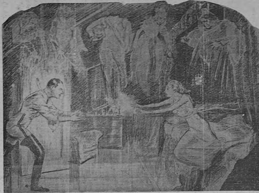
Intilmente trató de convencer a su esposa de que no había fantasmas... La princesita estaba aterrizada. Los espectros la rodeaban constantemente.

FANTASMAS DE REYES ASESINADOS, REINAS DECAPITADAS, ESPECTROS TENEBRÓSOS, RUIDOS Y GRITOS HORRIBLES. ¿EN DONDE FIJARAN SU RESIDENCIA LOS CONYUGES?