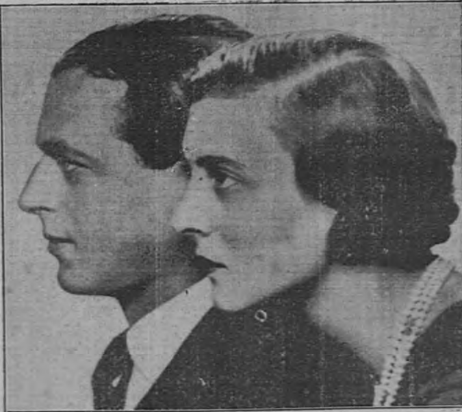
Los perfiles de los cónyuges reales. Preciosa fotografía hecha en una galería londinense.

Según la tradición, una noche el duque de Cumberland dormía apaciblemente en su lujoso lecho, ajeno a la tragedia que se cernía sobre él. De pronto, se despertó sobresaltado, y por unos segundos quedó aterrado al ver inclinado sobre él a su pérfido criado, quien, puñal en mano, se disponía a atravesarle el corazón y luchó a brazo partido con su agresor hasta vencerlo. El criado, al caer, lanzó un grito de terror, pero, logrando desasirse de las férreas garras del duque, se puso de pie y echó a correr por las galerías del castillo. El duque, enfurecido, lo persiguió hasta las habitaciones de la servidumbre. Lo que sucedió aquí ha quedado sumido en el más profundo misterio. Lo cierto es que a la mañana siguiente el criado fue hallado con el cuello rebanado.