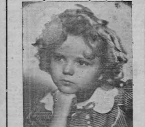
¡La maravilla del siglo! Con la formidable pareja GARY COOPER y CAROLE LOMBARD en la gigantesca obra dramática titulada...

a) ESTRENO! "NOTICARIO FOX" 8-18. b) ESTRENO! Extra musical! ¡VIVA LA PUMBA! c) GRANDIOSO SUPER ESTRENO! "P A R A M O D E N T" EL SUPREMO COLOSO DE LA EMOCION SUBLIME!! INTENSO! CONMOVEDOR! Tres colosos de la pantalla SHIRLEY TEMPLE