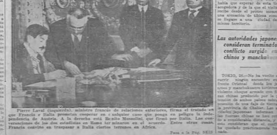
Pierre Laval (izquierda), ministro francés de relaciones exteriores, firma el tratado en que Francia e Italia prometen cooperar en cualquier caso que ponga en peligro la independencia de Austria. A la derecha está Benito Mussolini, que firmó por Italia. Las conversaciones de los dos estadistas en Roma terminaron en el acuerdo. Entre otras cosas, Francia convine en traspasar a Italia ciertos terrenos en Africa. Para a la Pág. OCHO.

Una carta urgente de Mussolini.— Había que celebrar el pacto franco-italiano antes de que se efectuara el plebiscito del Sarre