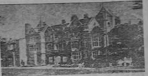
El hermoso castillo de Holand, otro de los habitados por espectros. En general todos los castillos ingleses tienen extraordinarias leyendas de fantasmas. En dónde, pues fijarán su residencia los duques de Kent?

En 1066, el rey Guillermo, el llamado conquistador y también el Bastardo, venció a Haroldo II en la célebre batalla de Hastings. Siendo muy religioso, mandó a construir una abadía en el lugar en que se celebró la batalla, y ordenó a los monjes que diariamente se entonasen un miserere en memoria de los héroes que perecieron en ella. Los monjes cumplieron fielmente esta orden hasta que el rey Enrique VIII, separándose de la iglesia, mandó cerrar la a-